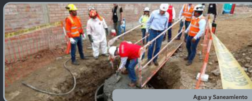
Agua y Saneamiento