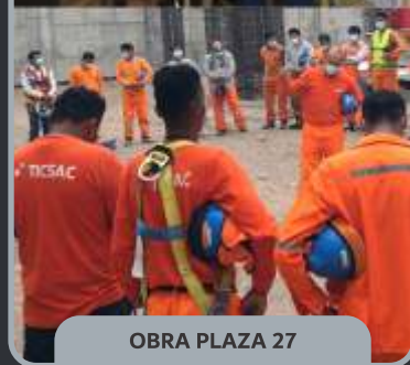
OBRA PLAZA 27