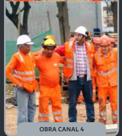
OBRA CANAL 4