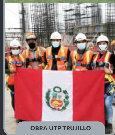
OBRA UTP TRUJILLO