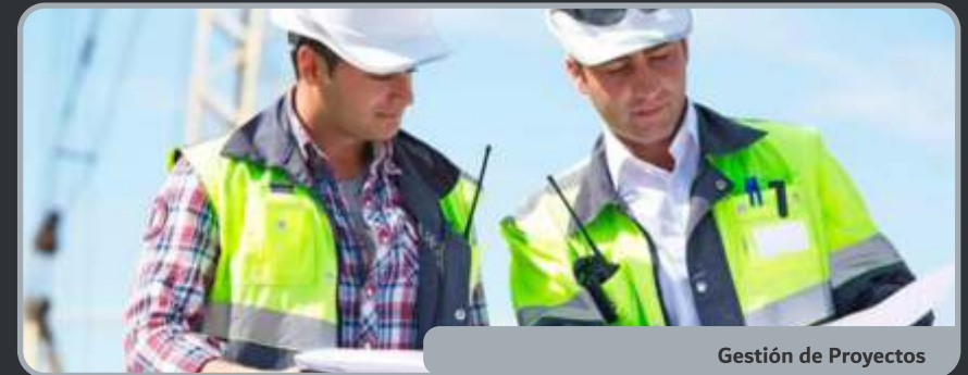
Gestión de Proyectos

Diseño de proyectos de automatización industrial, desarrollado de forma innovadora, eficiente y funcional. Nos basamos en las necesidades y requerimientos de nuestros clientes, aportando nuestra amplia experiencia con diferentes sistemas de automatización y control de procesos. ■