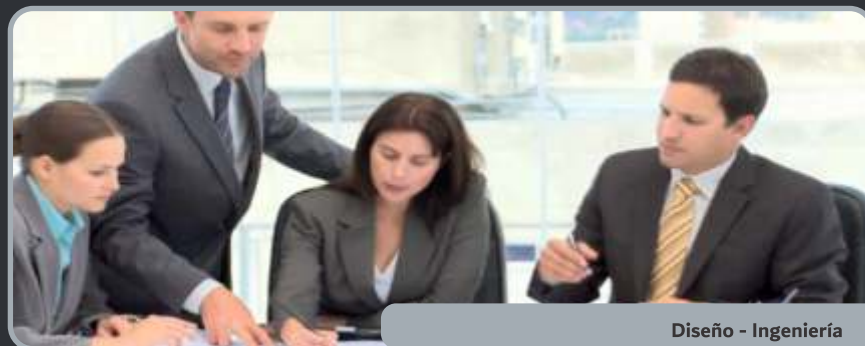
Diseño - Ingeniería