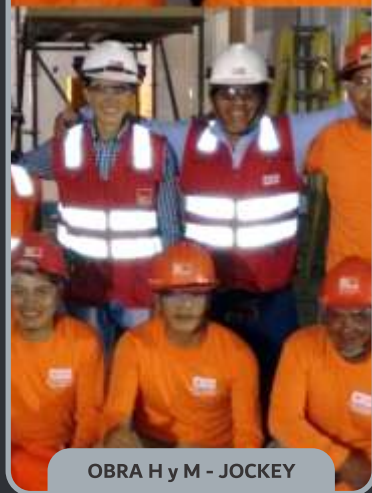
OBRA H y M - JOCKEY