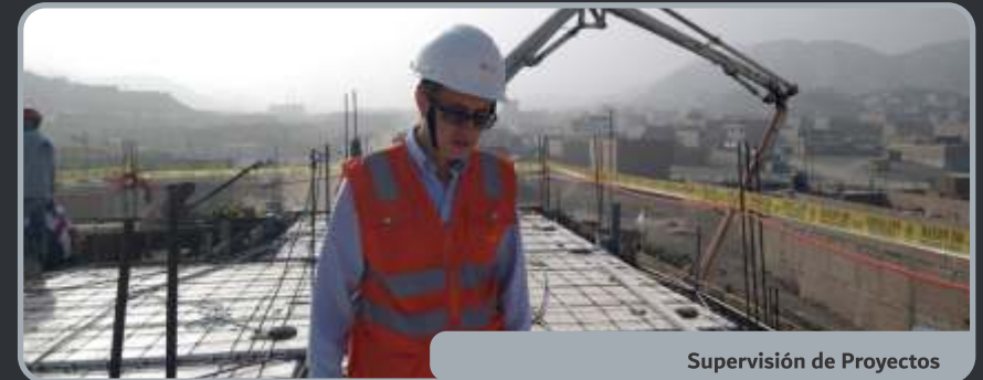
Supervisión de Proyectos