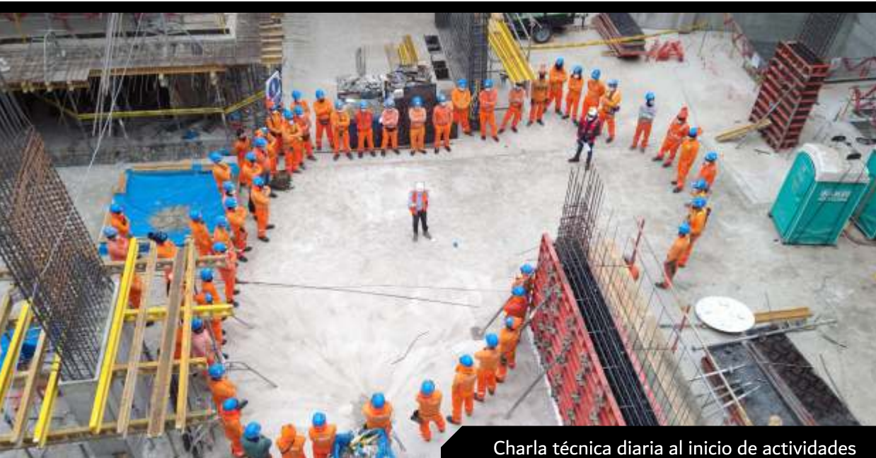
Charla técnica diaria al inicio de actividades

TICSAC es una constructora con experiencia en desarrollo inmobiliario con proyectos de vivienda masiva, vivienda tradicional, Hoteles y de oficinas. Esta experiencia hace que tenga la capacidad de trabajar con nuestros clientes desde la concepción de sus proyectos, brindando un gran soporte que genera valor en los negocios al optimizar recursos, plazos y costos. Y es gracias a este sólido respaldo logrado con experiencia, profesionalismo y constante actualización tecnológica, que podemos garantizar a nuestros clientes la entrega de un proyecto con los más altos estándares de seguridad, calidad y entregado antes del plazo pactado, respetando y protegiendo el medio ambiente, y generando oportunidades de desarrollo para las comunidades vecinas al proyecto.