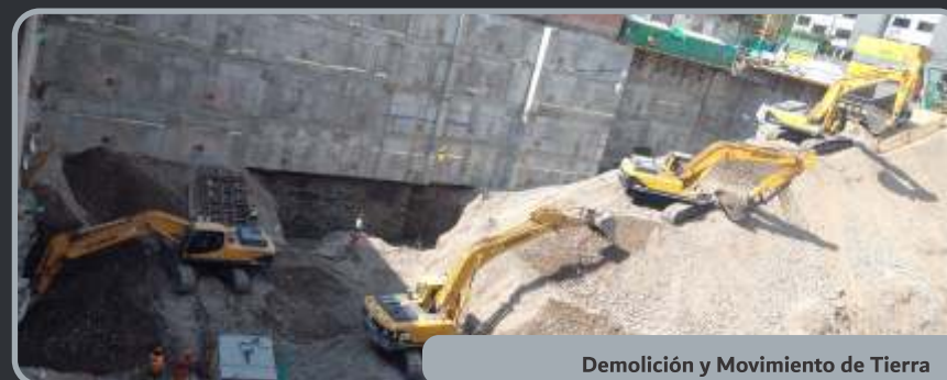
Demolición y Movimiento de Tierra

Trabajos de Infraestructura de producción agua potable, Ejecución de obras de Saneamiento, Tratamiento de aguas residuales para reúso y aprovechamiento de residuos sólidos, Gestión de los servicios de agua y saneamiento.