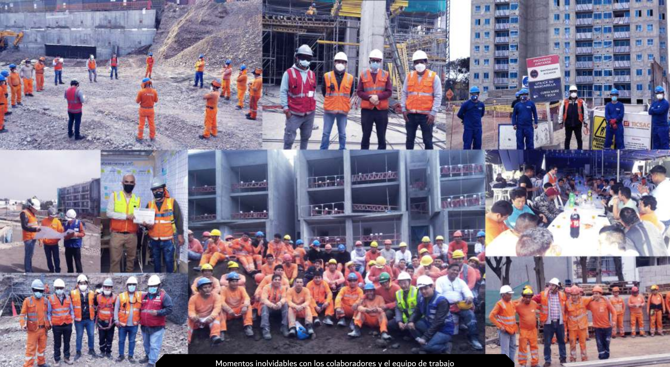
Momentos inolvidables con los colaboradores y el equipo de trabajo