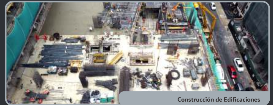
Construcción de Edificaciones

En el sector de metalmecánica, nos dedicamos a la fabricación y montaje de estructuras metálicas, arenado, pintura, soldadura, etc. La experiencia desarrollada durante su existencia y el conocimiento de las tecnologías vigentes son nuestro respaldo al momento de ofrecer nuestros servicios. Estamos enfocados a dar servicio; Industrial, Residencial, Comercial y Educativo por lo que nos ocupamos de contar con Personal Altamente Capacitado. Expertos en soldadura, herrería y reparación, brindando así un Servicio de Calidad, aumentando con ello la capacidad productiva de su empresa; siempre enfocados a la optimización de «Tiempo y Costo».