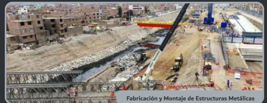
Fabricación y Montaje de Estructuras Metálicas