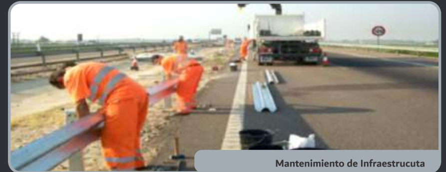
Mantenimiento de Infraestructura