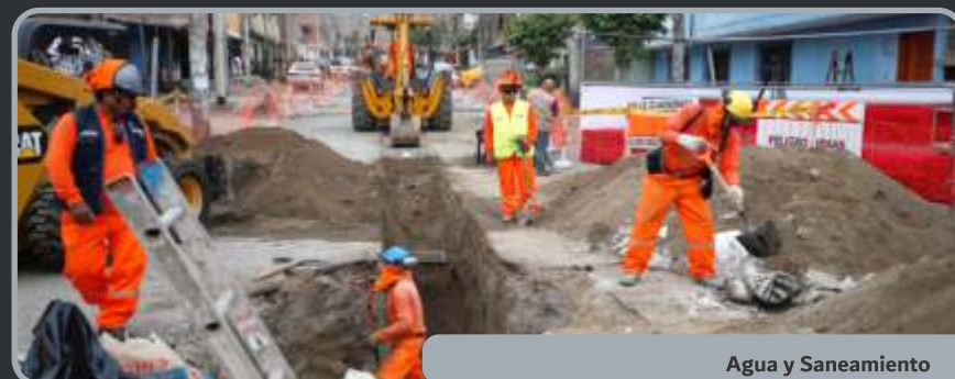
Agua y Saneamiento