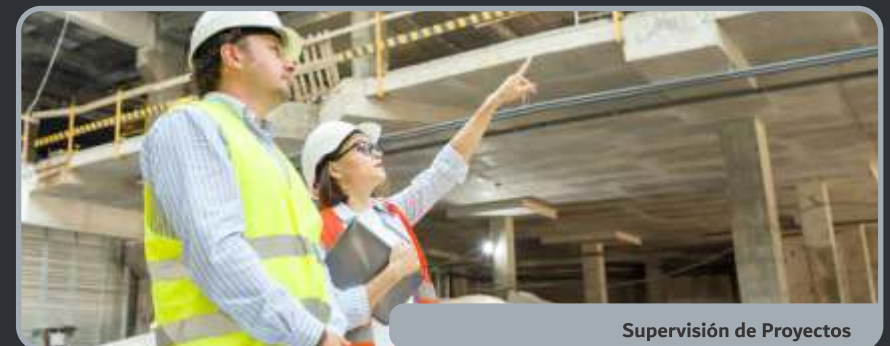
Supervisión de Proyectos